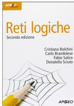
Reti Logiche Bolchini, Brandolese, Salice, Sciuto Apogeo, 2008