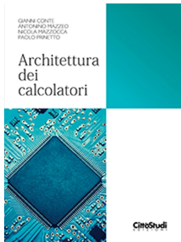
Architettura dei Calcolatori Conte, Mazzeo, Mazzocca, Prinetto CittaStudi, 2015