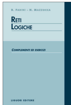
Reti Logiche: complementi ed esercizi Fadini, Mazzocca Liguori, 1995