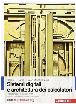
Sistemi digitali e architettura dei calcolatori Progettare con tecnologia ARM D.M. Harris, S.L. Harris Zanichelli, 2017