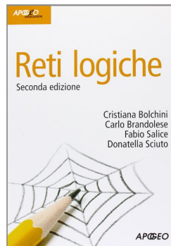
Reti Logiche Bolchini, Brandolese, Salice, Sciuto Apogeo, 2008